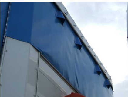
Ausführungsbeispiel: vorne – oben

Darüber hinaus gilt auch die Nutzung einer funktionierenden technischen Lüftung (Gebläse mit entsprechenden Auslassöffnungen) als „ausreichend belüftet“.