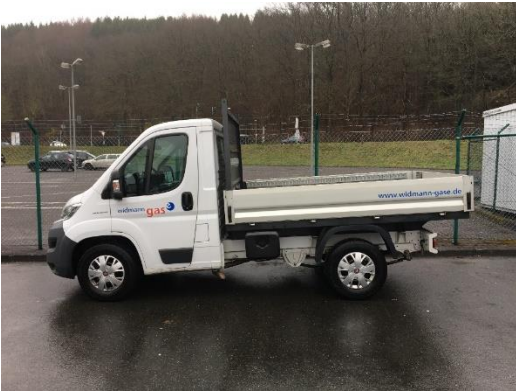
Ausführungsbeispiel: offenes Fahrzeug

Kommen die vorstehend beschriebenen Freistellungen nicht zum Tragen, sind Gase vorzugsweise in offenen oder belüfteten Fahrzeugen zu verladen. Ist dies nicht möglich, muss das Fahrerhaus/die Fahrgastzelle gasdicht vom Laderaum getrennt sein.